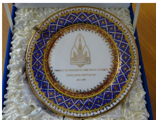
コンケン大学から届いた飾り皿