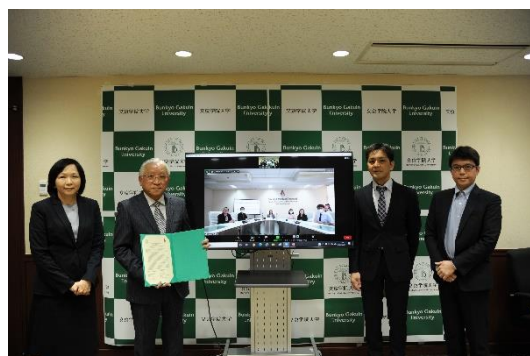
オンライン協定締結式