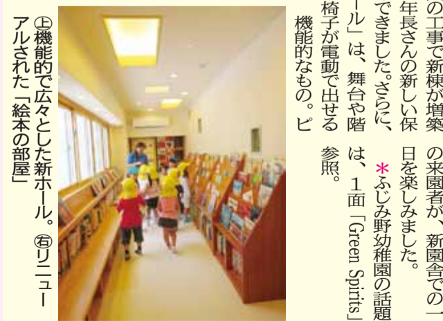
①機能的で広々とした新ホール。②リニューアルされた「絵本の部屋」