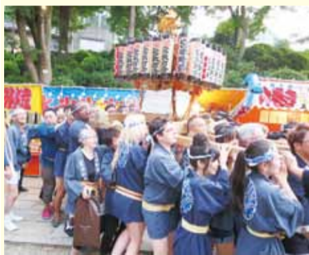
元気な留学生たちは注目の的

「Shinto and Buddhism in Japan」の授業の一環として、毎年、同町会の協力を得て実施されています。当日は、留学生一同、町会の方々から神輿担ぎの講習を受けた後、法被とねじり鉢巻を身につけて、いなせな出で立ちに変身。本喜はせました。