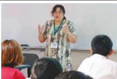
深い臨床経験に基づいた神作教授の研修会

同研修会第1回の講師に、ふじみ野市内で特別支援教育に取り組む教員を対象に、数多くの臨床経験に基いた内容を展開しました。基調講演は、「ふじみ野市現役教員と学生が共に」と題し、発達障害のある子どもとその対応について、①「ふじみ野市」の背景、②感覚統合療法的な視点から見た発達障害、③発達障害のある子どもとその対応など、「通常の学級に在籍する発達障害のある子ども」の教育的支援を必要とする児童