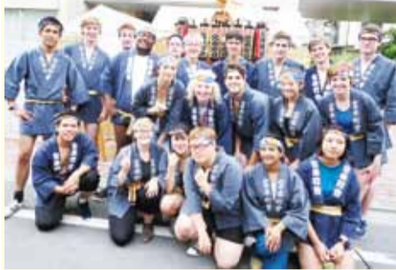
宮本町の神輿の前でワクワク

根津神社例大祭(影祭)が9月21日と22日に開かれ、町内会の神輿が神社境内と根津の町を練り歩きました。その中のひと宮本町の神輿の前でワクワク