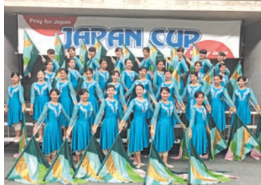
「リトルマーメイド」の衣装で勢揃い

8月の「全国高等学校ダンスドリル選手権大会2014」で優勝したカラーガード部が、9月14日に東京体育館で行われた「JAPAN CUP マーチングバンド・パントロン・グランド・パントロン」で再び大活躍しました。本校は「第2位」を獲得しました。