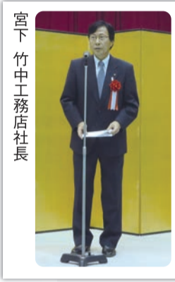
宮下竹中工務店社長