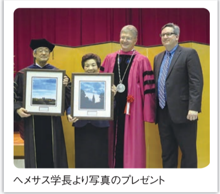
ヘメス学長より写真のプレゼント