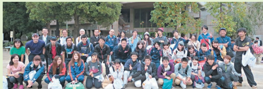
強いチームワークを誇る文京学院メンバーの笑顔

をかけたところ、口内菌は消えましたが、納豆菌は生存。ふたりは、「納豆菌が口内菌を消滅させたのかを調べたい。口臭が強くなる原因として、口が湿くと菌が増殖しやすくなると