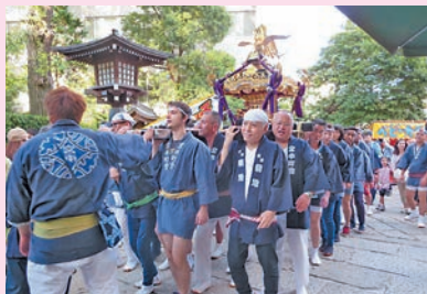
根津宮本町会の神輿を担ぐ留学生たち

今年、根津宮本町会に、アメリカ合衆国・ブルガリア・マレーシア・ネパール・トルコ・台湾からの交換留学生15名が参加。いなせなねじり鉢巻きと、男子学生は締め込み姿で根津宮本町会の方々と共に新調された大きな神輿を担ぎ、神社境内に繰り出しました。沿道の人々から、声援と拍手を送られた留学生たちは、「セイヤ！」の掛け声を一段と大きくしました。