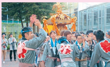
追分睦(向丘追分町会)の神輿が学内に

また、本学の学生37名と教職員6名が地元追分睦(向丘追分町会)の神輿担ぎに参加。本学の農業インターンシップ受け入れをしてくださっている群馬県前橋市富士見町の方々も一緒に大きな掛け声を上げ、神輿を担ぎました。神輿は本郷キャンパス内も練り歩き、再び外へ。終了後、参加者約140名による懇親会が、B'sダイニングで開かれ、交流を深めました。