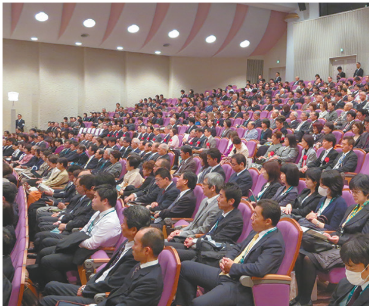
仁愛ホールには750名の参加者が

また、本学の学生37名と教職員6名が地元追分睦(向丘追分町会)の神輿担ぎに参加。本学の農業インターンシップ受け入れをしてくださっている群馬県前橋市富士見町の方々も一緒に大きな掛け声を上げ、神輿を担ぎました。神輿は本郷キャンパス内も練り歩き、再び外へ。終了後、参加者約140名による懇親会が、B'sダイニングで開かれ、交流を深めました。