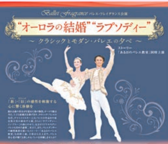
今年の豪華なクリスマス公演

来場者には、①香り袋または香りのしおりプレゼント(各日先着200名)、②小冊子「バレエの楽しみ方」プレゼント(過去公演のパンフレット付、各日希望者100名)、③オペラグラス無料貸し出し(カンフェティからのチケット購入者限定)の特典がある。【日時】12月4日(木)19時、5日(金)18時半開演 【場所】シアター1010(北千住マルイ11階) 【料金】S席5,000円、A席4,000円、子ども(5~11歳)3,000円 【チケット】①☎0120-240-540(カンフェティ・平日10時~18時) http://www.confetti-web.com ②yumiko@classic.interq.or.jp (バレエ・フレイグランス事務局) ③☎5244-1011 (シアター1010)