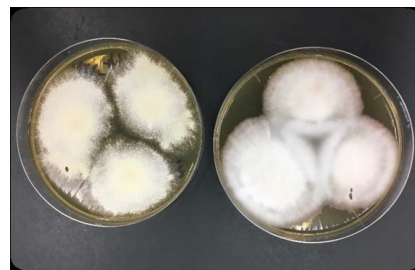
足白癬を引き起こす白癬菌 Trichophyton mentagrophytes (左) Trichophyton rubrum (右)

私は2014年から、埼玉県さいたま市で地域の介護や福祉、医療などのサポートを行う「地域包括支援センター」運営協議会の会長を務めています。そ