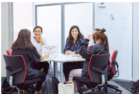
学内にあるチャット・ラウンジの様子

海外に容易に渡航ができない現状において、大学の国際交流もオンライン化が進んでいます。特に海外の大学の中には先進的な国際交流事業を行っているところも多く、本学と提携関係を結ぶ大学からもオンラインを活用した留学プログラムの提案が数多く届いていて、海外の大学の方がそうした動きに積極的な印象を受けます。本学でも既存の国際交流をオンライン化した取り組みが始まっており、そのひとつが「オンラインチャット・ラウンジ」です。