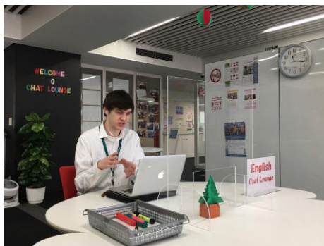
オンラインチャット・ラウンジ実施の様子

ルに直面するよりもオンラインの方が話しやすいと感じる学生も多いようです。そのほかにも交換留学提携校であるアメリカのセント・ジョンズ大学とオンライン交流を企画したり、学内の留学生と交流するオンライン国際交流会を開催したりと、あるいはGCIの一環である海外インターンシップにもオンラインの仕組みを取り入れたりと、少しずつ新しい取り組みが始まっています。