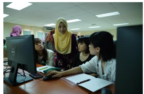
アジア圏で実施する海外プログラムの様子